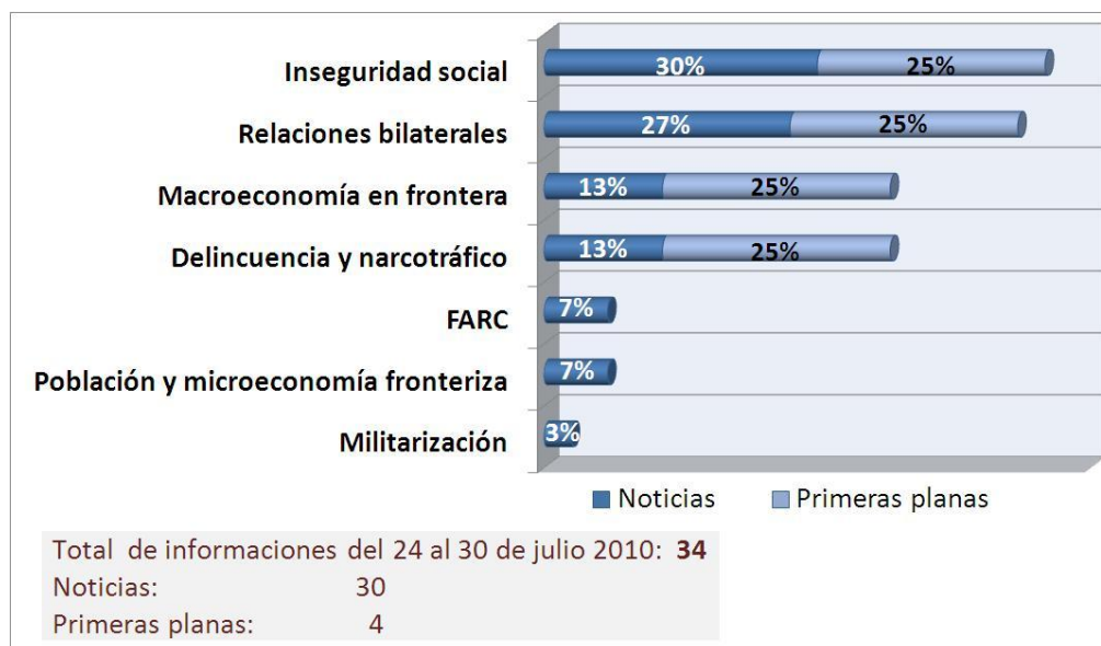
Gráfico 1.

Durante la presente semana, la información sobre fronteras disminuyó en un 54% con relación a la semana anterior. El tema "Inseguridad social" fue el área temática con mayor despliegue y