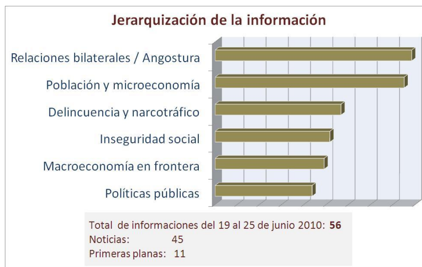
Gráfico 1.