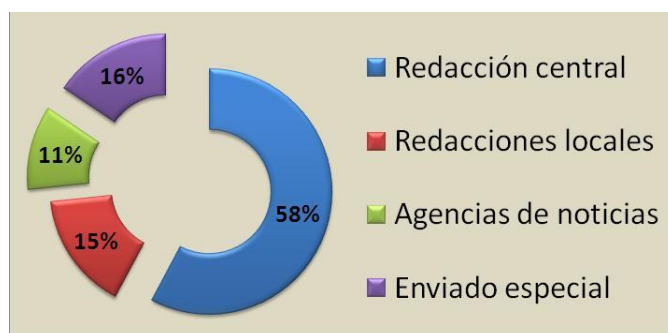
Gráfico 4.

Las redacciones centrales de los diarios analizados están ubicadas en Quito o Guayaquil, mientras las redacciones locales, en este estudio, se refieren a lugares ubicados en frontera (Esmeraldas, Sucumbíos y Carchi).