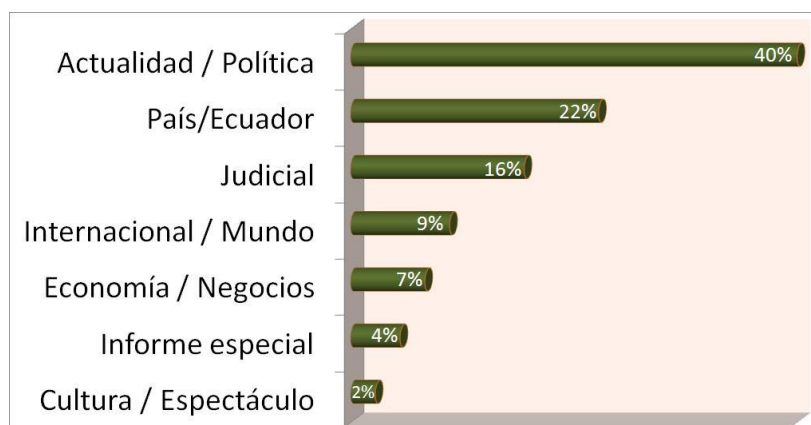
Gráfico 2.