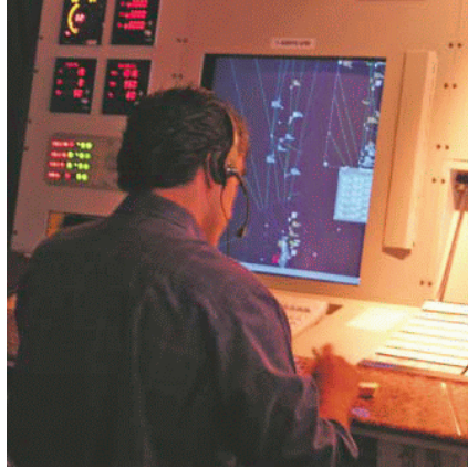
Pantalla de presentación de trazas radar (aeronaves).

Además se conseguirá disminuir los incidentes en el Área del TMA y las recomendaciones OACI, por lo tanto se puede mantener la categoría Primera dada al país.