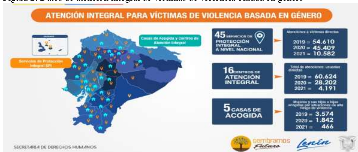
Figura 2. Datos de atención integral de víctimas de violencia basada en género