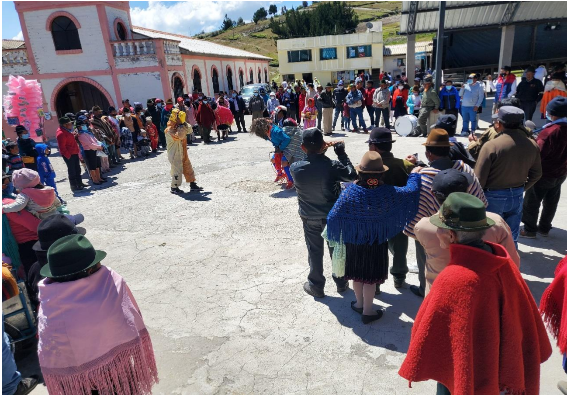
Evento cultural / fiesta comunitaria con personajes míticos.