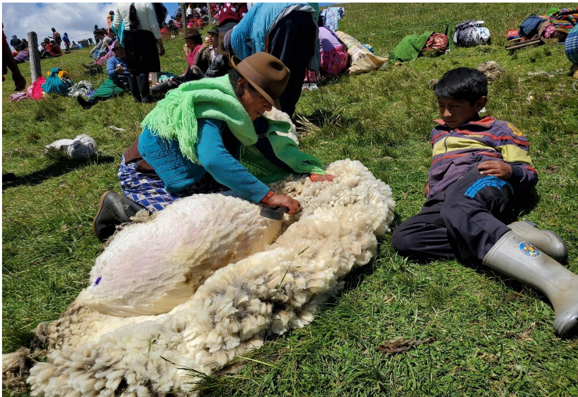
Actividad complementaria de la mujer y transmisión de conocimientos a la niñez.