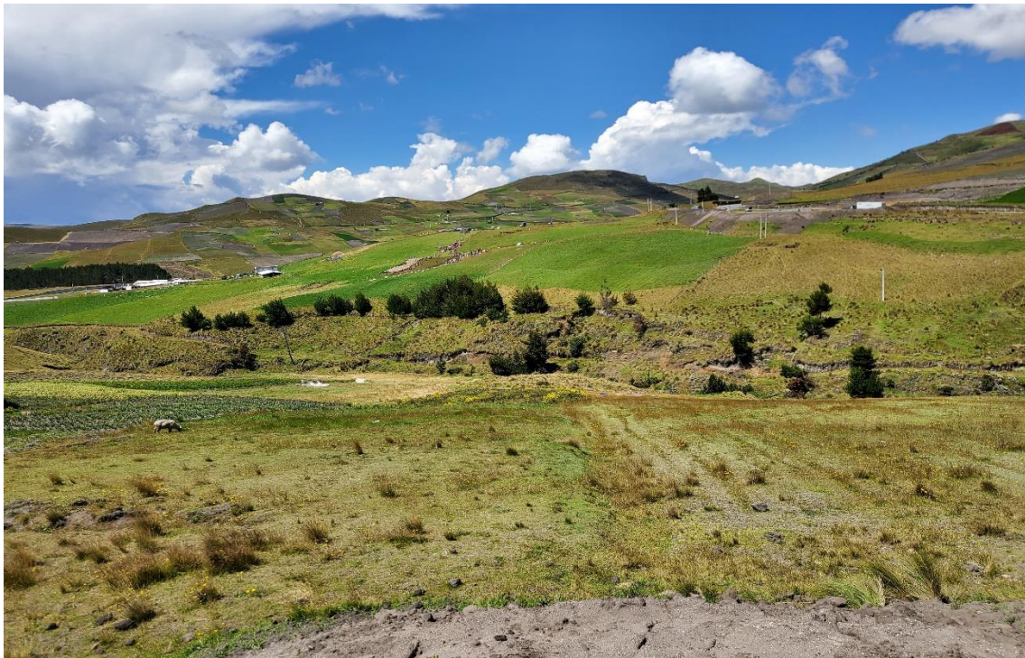
Vista panorámica del territorio de Maca Grande / madre tierra donde se realiza la convivencia comunitaria.