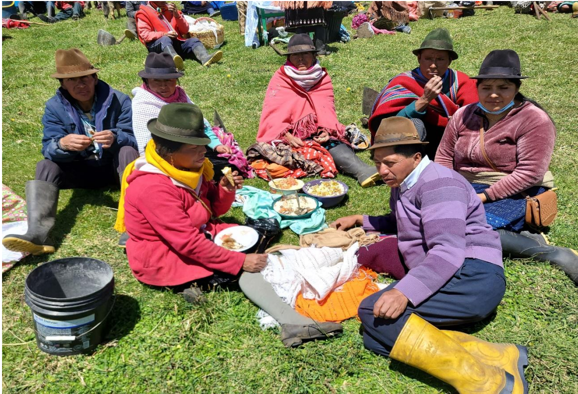
Pamba mesa / almuerzo comunitario.