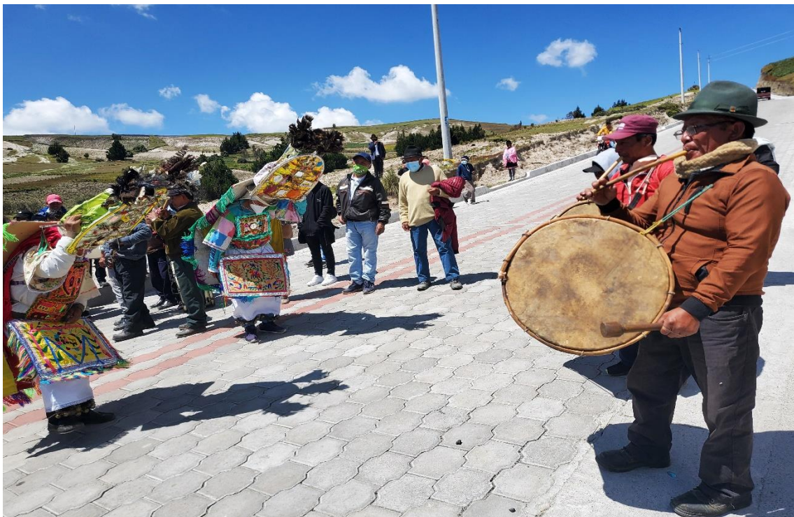
Música autóctona y danzantes en la fiesta del sol.