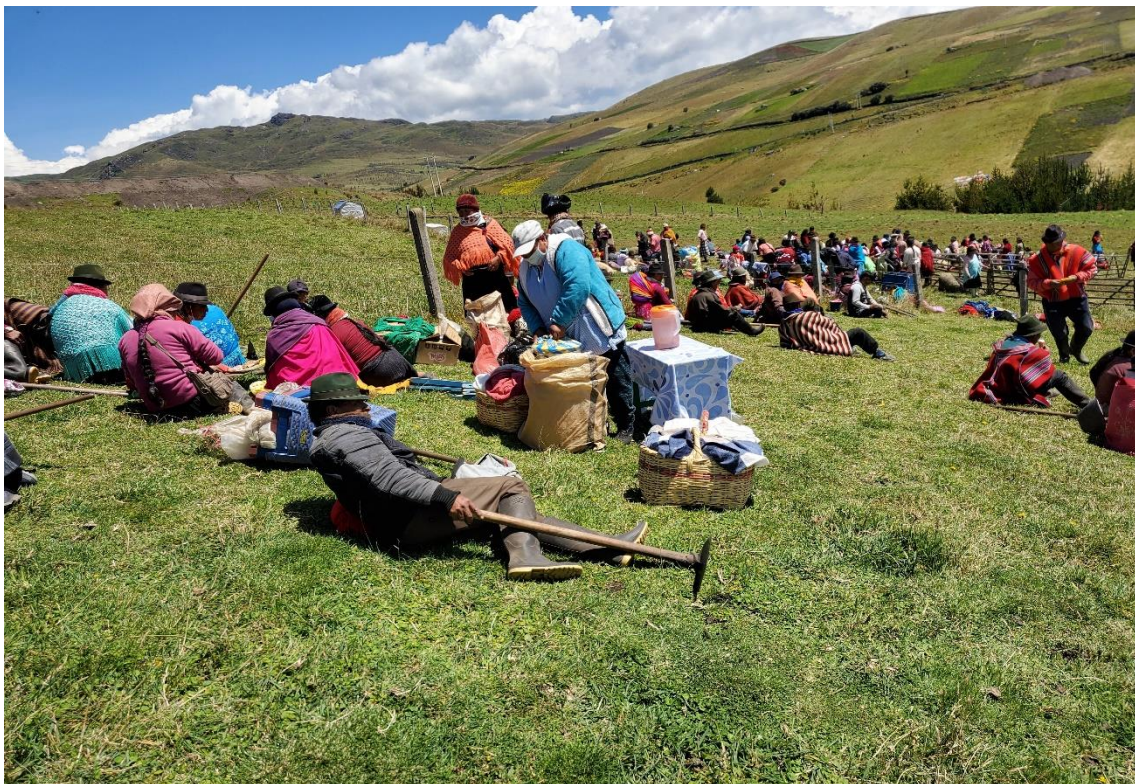
Minga comunitaria / actividad colectiva.