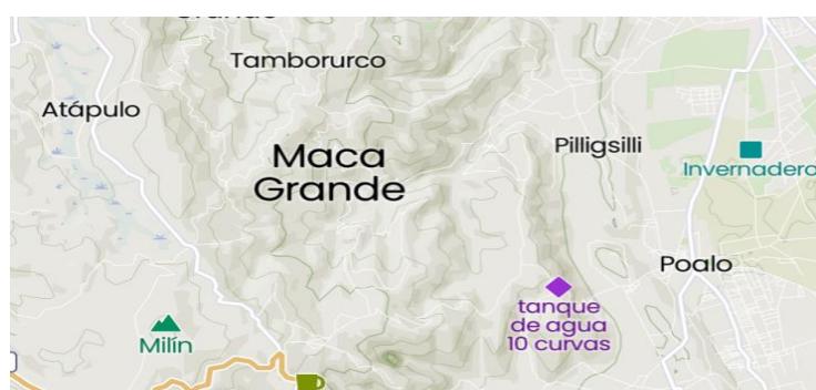
Gráfico 1 Ubicación de la Comunidad Maca Grande, parroquia Poaló, cantón Latacunga, provincia de Cotopaxi.

Cuenta con una población de tres mil (3.000) habitantes, aproximadamente, según el registro de los jefes de hogar por la comunidad, se divide en ocho sectores reconocidos bajo la denominación de comités promejoras. Maca Grande obtiene la personería jurídica en el año 1937, convirtiéndose en comunidad jurídica de derecho, mediante Acuerdo Ministerial Nro. 227, conferido por el extinto Instituto Ecuatoriano de Reforma Agraria y Colonización – IERAC, y ratificado por el hoy Ministerio de Agricultura y Ganadería – MAG.