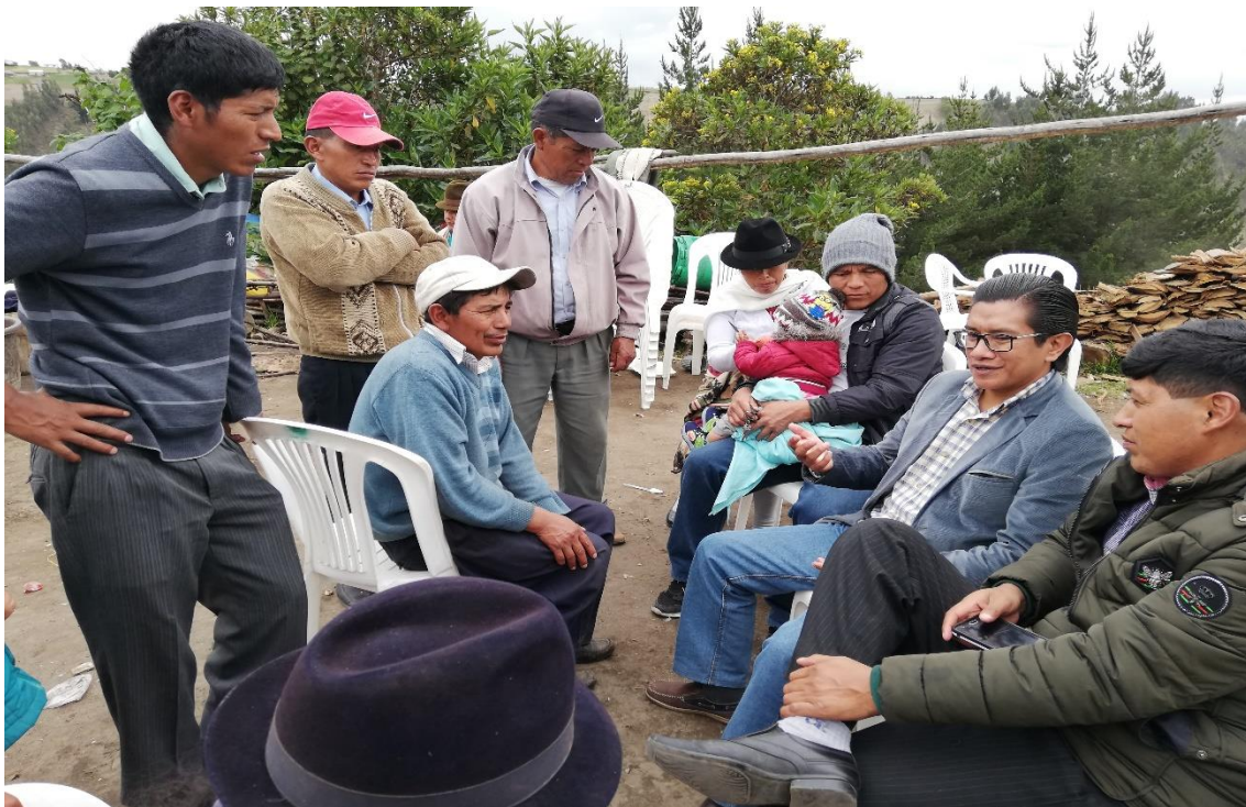
Actividad de campo / entrevista a los directivos y comuneros. Fuente: realización y registro personal.