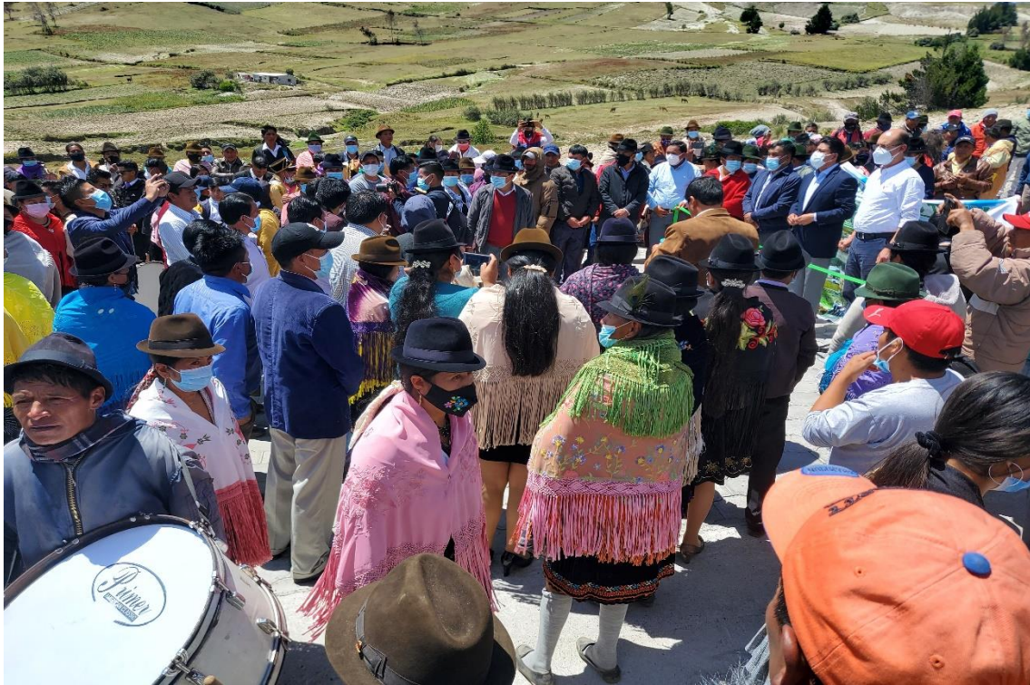
Asamblea comunitaria / solución de conflictos.