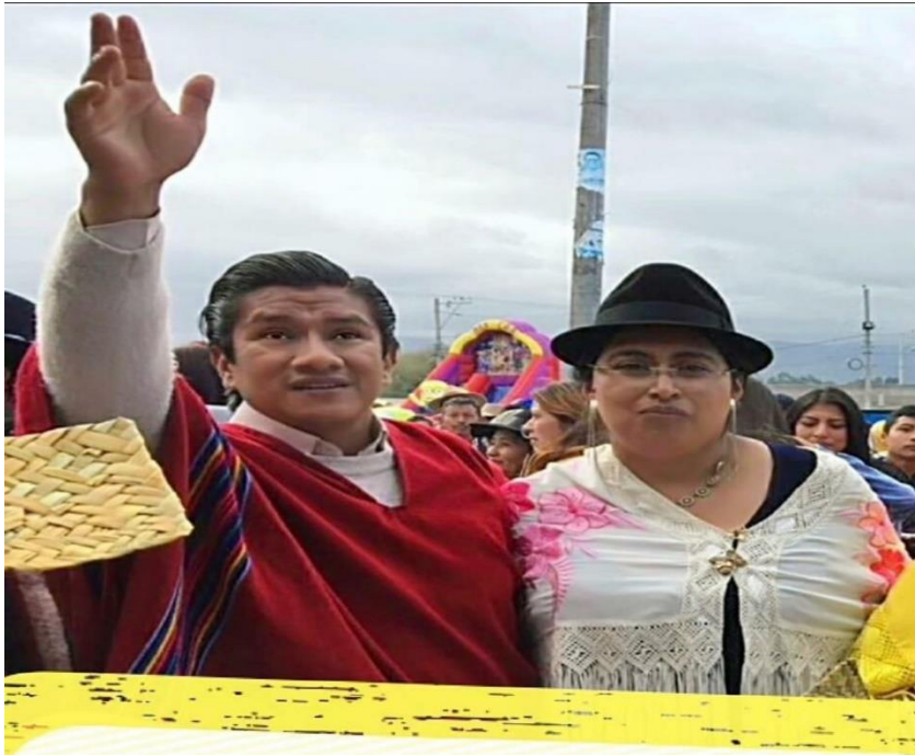
Actividad de campo.