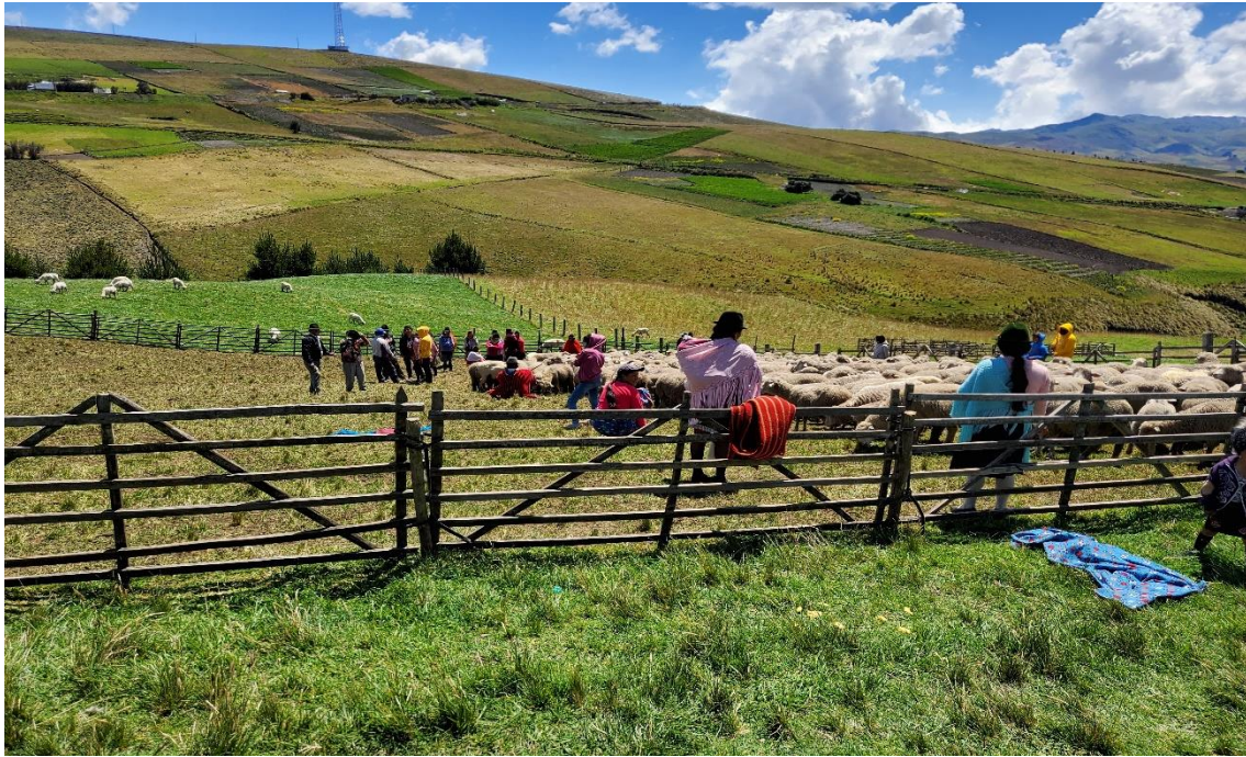
Proyecto social comunitario / crianza de ovinos.