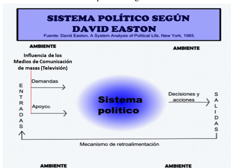
Los Sistemas políticos según David Easton

Fuente: David Easton, 1965 A System Analysis of Political Life. New York