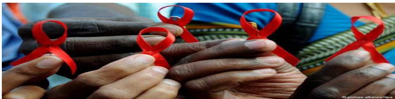
Figure 6