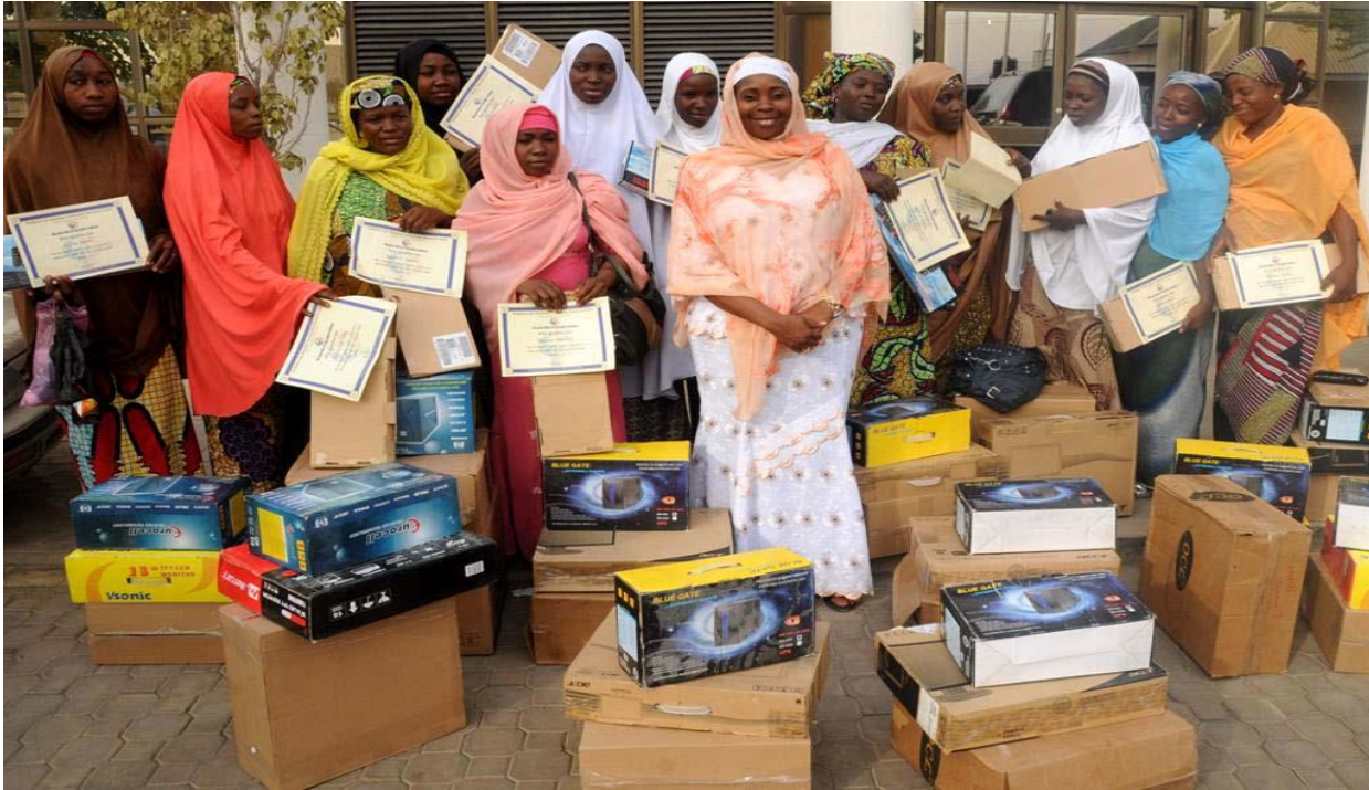
Figure 3 Fuente: Royal Times Nigeria / 2012

La desigualdad de género se ve reflejado en las cifras de un 10% más de niños tienen acceso a la educación que las niñas. Esto también se ve influenciado por las cuestiones religiosas, en especial en la tribu Hausa, de religión Islam, donde las niñas tienen menos derechos y acceso a la educación, además de estar expuestas a vivir en exclusión, confinamiento y a la mutilación genital, a pesar de que recientemente se prohibió esta práctica en el país.