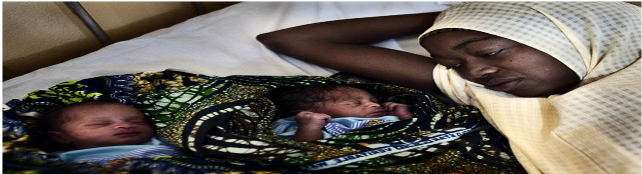
Figure 5

El tema de la salud es extremadamente grave en Nigeria. La salud gratuita no existe. Incluso, los centros de salud públicos, con altos niveles de insalubridad y precariedad, deben ser pagados por los pacientes. La medicina es de muy cara y de mala calidad. Hay un gran porcentaje de medicina falsificada o adulterada en el mercado. En la salud materna de cada 100.000 partos, 350 mujeres pierden la vida. El nivel de mortalidad aún es muy alto, y no cumple con los objetivos de reducir la mortalidad a un mínimo de 250 por cada 100.000 partos. En el año 2014, la esperanza de vida en Nigeria era de 52,75 años.