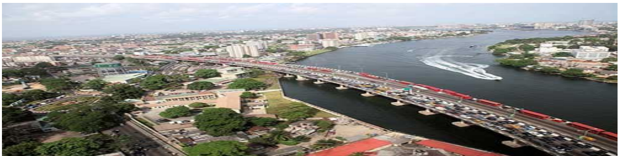
Figure 8

Este objetivo es por mucho el mejor y en el que Nigeria ha progresado. Económicamente Nigeria ha duplicado su PIB per cápita desde el 2000, aunque el índice de GINI es del 0.488, (Anexo 3) demostrando que la desigualdad entre ricos y pobres es aún muy alta. El acceso a la tecnología ha mejorado mucho en Nigeria, y a la comunicación en un 68.49%. Pero a pesar de este incremento, en lo particular, el acceso a internet es del 28.43%.