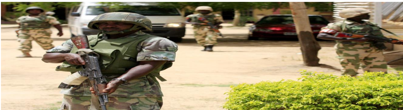
Figure 9