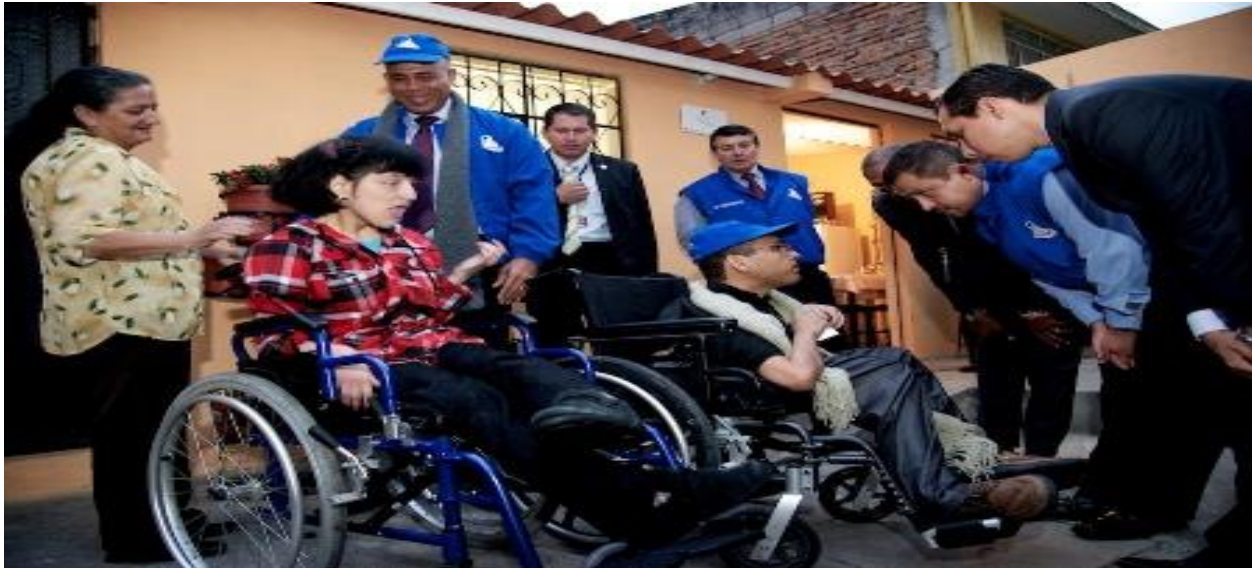
Figure 10

La modalidad de la cooperación Ecuatoriana es la Cooperación Sur-Sur, de modo que el Ecuador se especializa en la asistencia técnica, el intercambio de experiencia y la capacitación. Esta modalidad de cooperación le ha permitido al Ecuador compartir sus experiencias con muchos países.