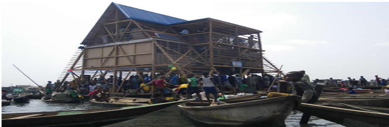
Figure 2 Fuente: Kunley Adeyemi, 2014, Escuela Flotante en Nigeria.

En el área de educación, según las cifras de los ODM en Nigeria, el 80% de la población ha terminado la primaria. Estas cifras dejan aun a 36 millones de personas sin terminar la primaria y a millones sin saber leer y escribir. Los niveles de analfabetismo en Nigeria rodean el 38.7% (PENUT, 2013).