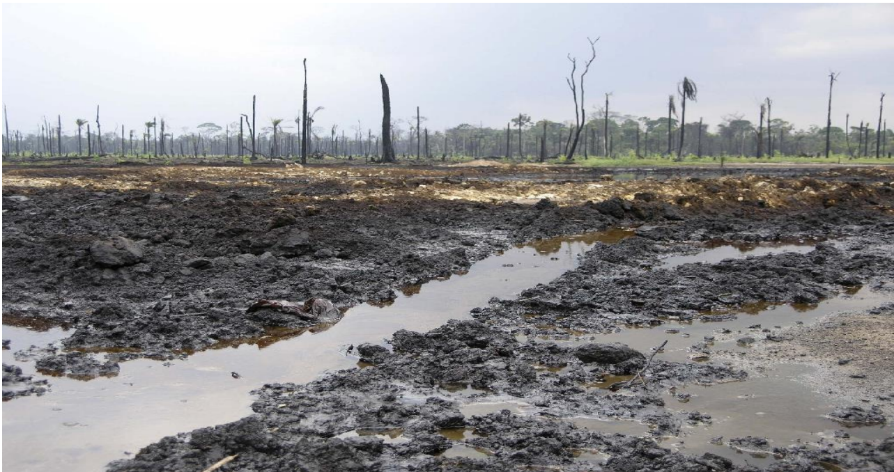
Figure 7

La actividad de extracción de petróleo en Nigeria es muy activa, de hecho, el petróleo representa un 40% del presupuesto anual del país. Sin embargo, no todo es positivo. Desde el inicio de la explotación de petróleo han ocurrido 6,817 accidentes de derrame de petróleo, lo que ha ocasionado una gran contaminación en el delta del río Níger, habitado por unas 20 millones de