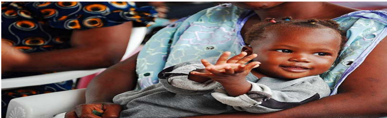
Figure 4