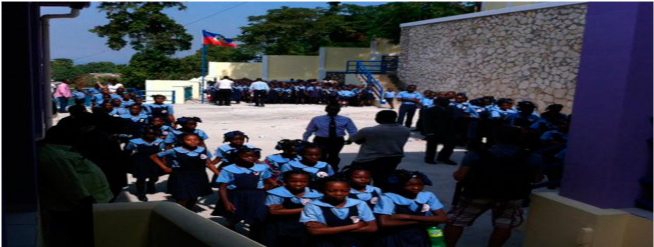
Figure 11

Otra cooperación muy visible a nivel internacional fue la entregada en Haití después del terremoto que asoló a ese país en el 12 de enero del 2010.