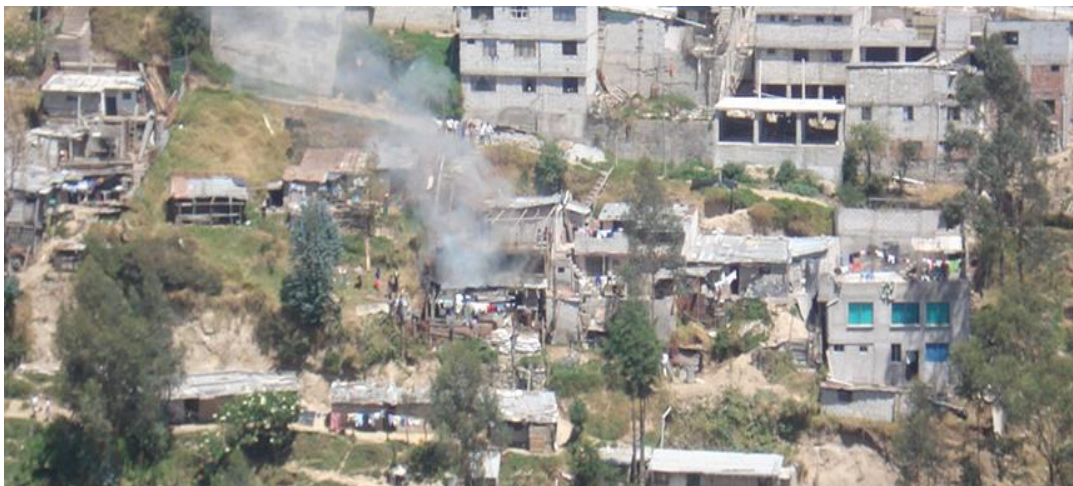
Figura 1. Fotografía de el Carmen Bajo, situado al Noreste de Quito.