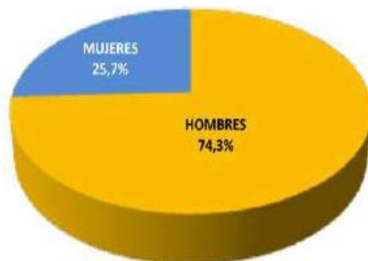
Figura 3. Autoridades electas principales según sexo