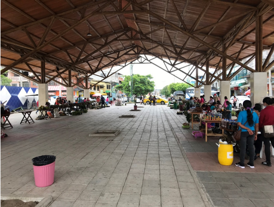
FIGURA 9. FERIA DE PRODUCTOS DE LA ZONA EN LA CIUDAD EL COCA