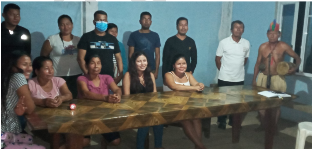
FIGURA 2. INTEGRANTES DE LA COMUNA FLOR DE PANTANO