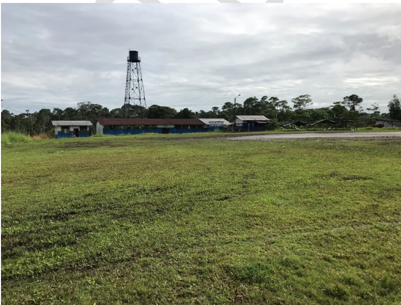
FIGURA 4. ÁREA DE RECREACION DE LA COMUNA FLOR DE PANTANO