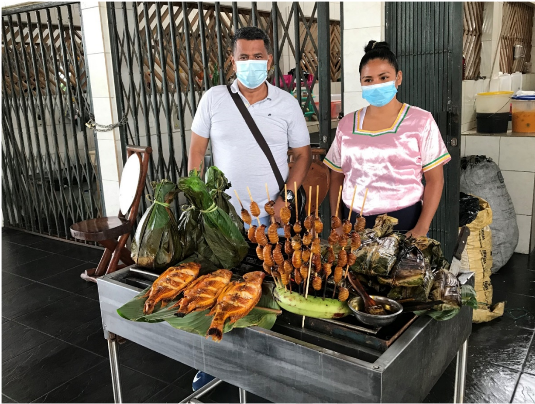
FIGURA 5. GASTRONOMIA DE LA COMUNA