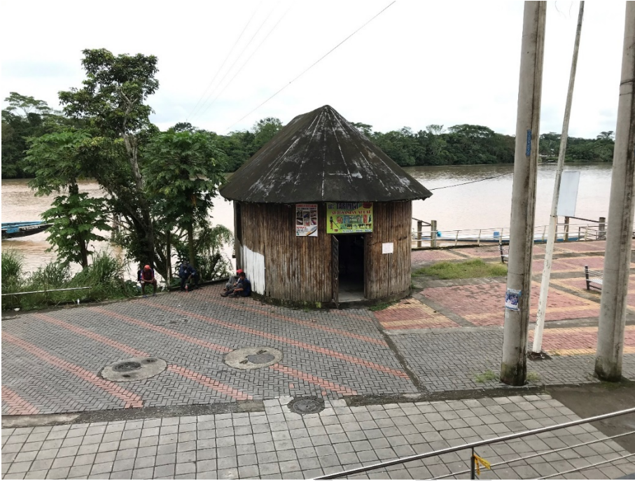
FIGURA 7. MALECON DE LA CIUDAD DE EL COCA