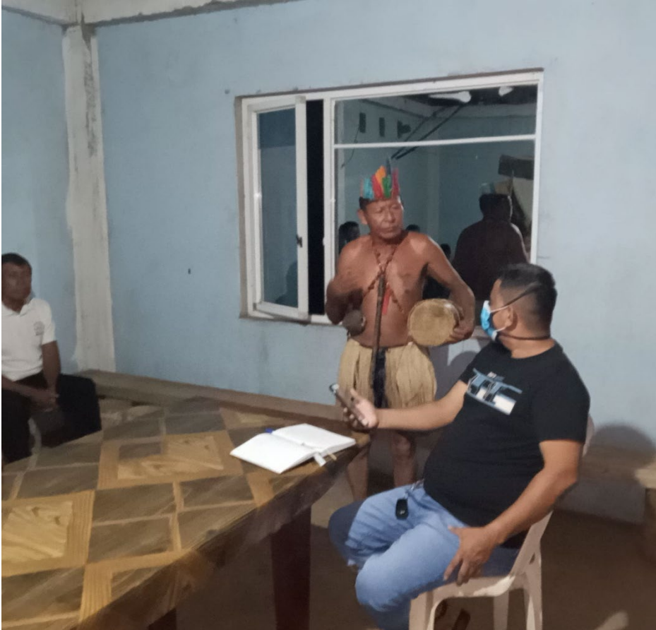
FIGURA 3. ENTREVISTA CON EL PRESIDENTE DE LA COMUNA FLOR DE PANTANO