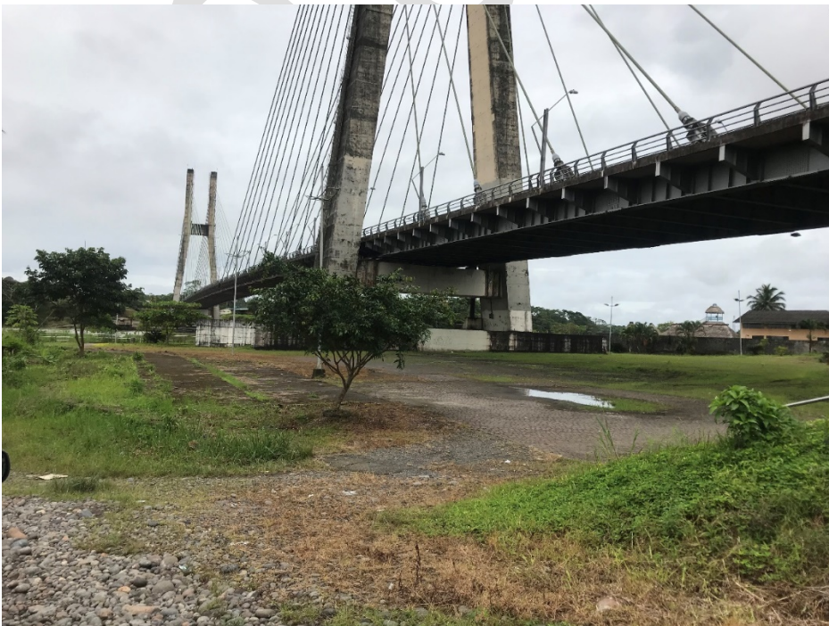
FIGURA 8. PUENTE COLGANTE DEL RÍO NAPO