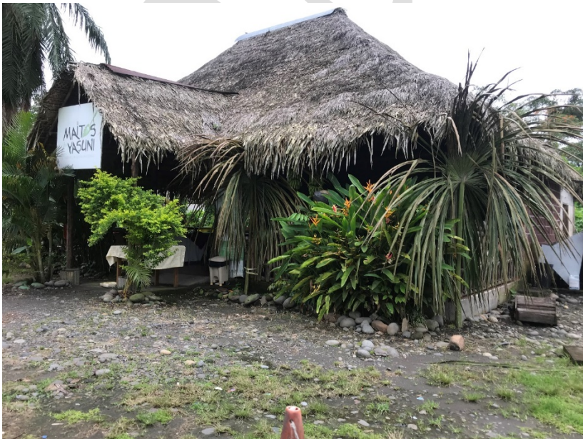
FIGURA 6. CENTRO DE COMIDAS TÍPICAS MAITOS YASUNÍ