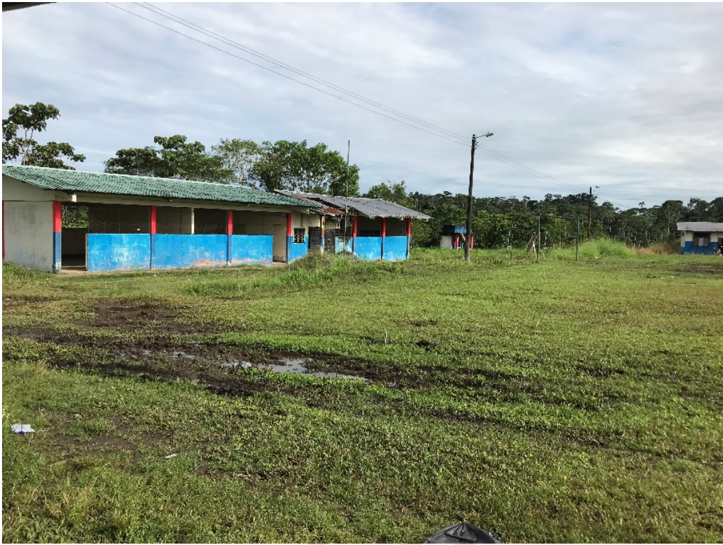
FIGURA 1. COMUNA FLOR DE PANTANO