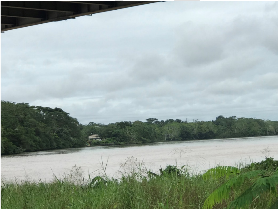
FIGURA 10. UNÓN DEL RIO NAPO Y PAYAMINO