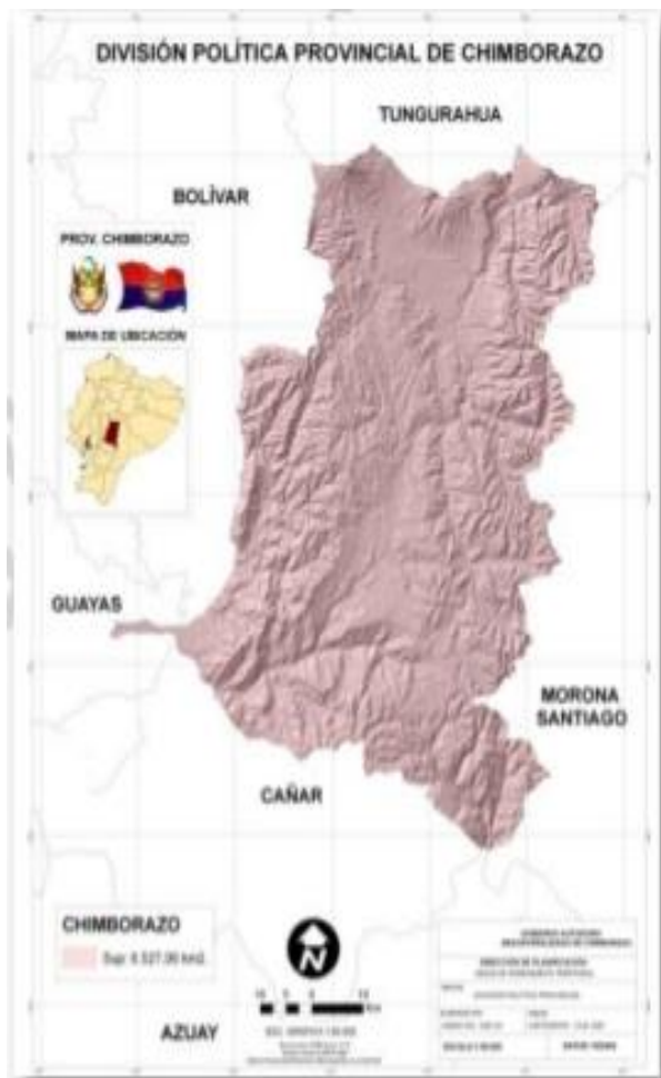
(Gobierno descentralizado de Chimborazo 2011)