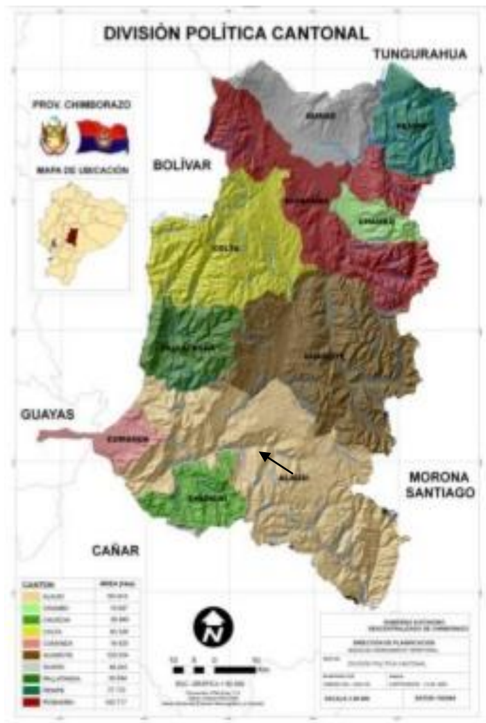
Mapa N° 3

(Gobierno Descentralizado de Chimborazo, 2011)