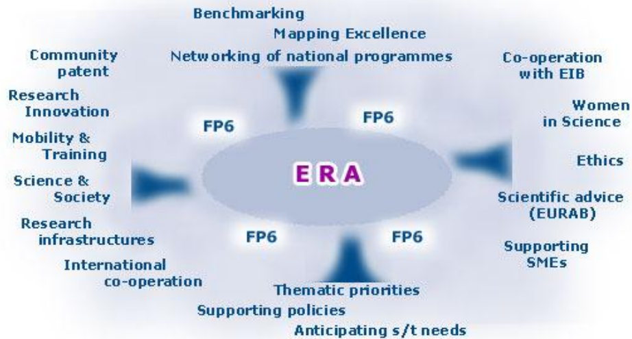
GRÁFICO 3.1. FOMENTO DEL ESPACIO EUROPEO DE LA INVESTIGACIÓN

dependen en gran medida de las actividades IDT (investigación y desarrollo tecnológico).