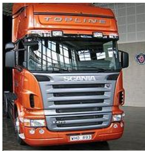
Camión Scania R470