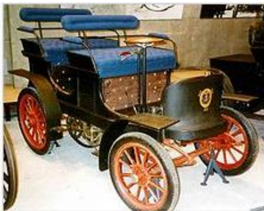
Scania A1 1901.