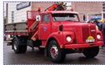
Camión Scania L80 1974