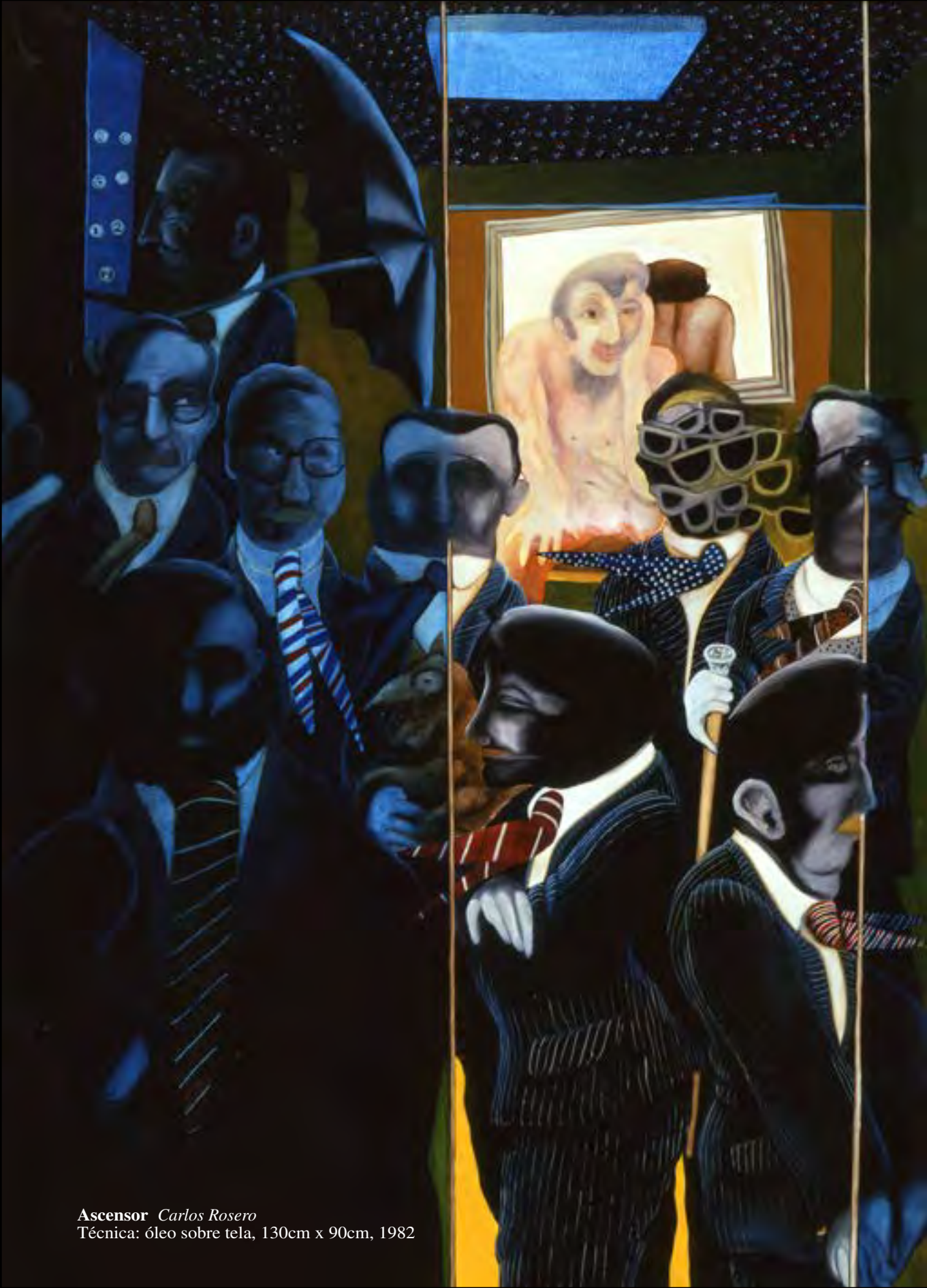
Ascensor Carlos Rosero Técnica: óleo sobre tela, 130cm x 90cm, 1982